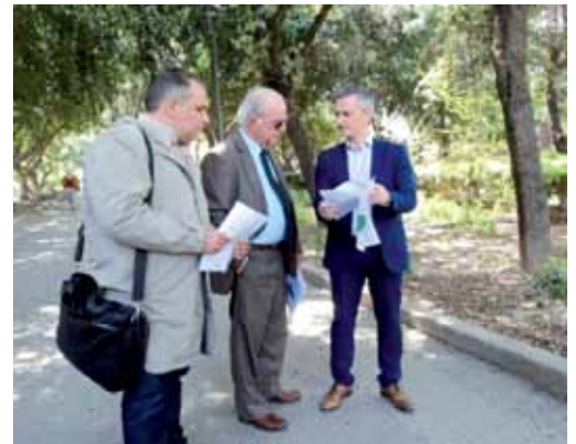
Ο Δήμος πού είναι;

Κοινωνική πολιτική δεν κάνει ο Δήμος Ηρακλείου, ούτε έργα, ούτε κινήσεις για την καθημερινότητα του πολίτη (πχ δημιουργία πάρκινγκ). Τα σκουπίδια και τα αδέσποτα είναι η μόνιμη ατραξιόν της πόλης. Ας φροντίσει λίγο τουλάχιστον τα δεντράκια. Μα δεν έχουμε και πολλά, για να πούμε την αλήθεια.