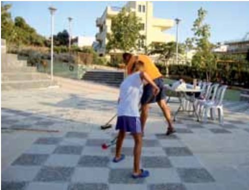
Πάρκο Μικράς Ασίας. Καθαριότητα από εθελοντές (προφανώς).

Θέλεις το πάρκο Γεωργιάδη; Το πάρκο Μικράς Ασίας; Το πάρκο Θεοτοκοπούλου; Θες τον ίδιο τον Θεοτοκόπουλο; Υιοθέτησε κάτι τέλος πάντων. Βάλε το χέρι στην τσέπη.