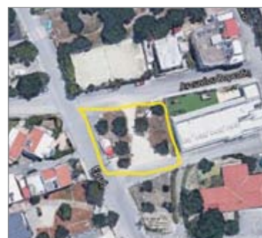
Ερμή & Αντωνίου Βορεάδη