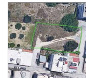
Κάθετος στην οδό Τερψιχόρης (ανώνυμη)