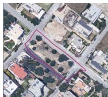
Ρασούλη και Δελαπόρτα

ΠΟΙΑ ΕΙΝΑΙ ΤΑ 12 ΣΗΜΕΙΑ ΣΤΟ ΠΡΟΑΣΤΙΟ ΤΟΥ ΑΪ ΓΙΑΝΝΗ