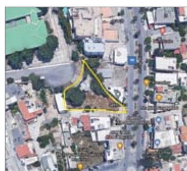
Λ. Κνωσού στο ύψος του Πανεπιστημίου