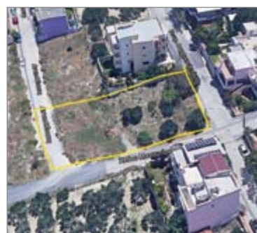
Φαραγκουλιτάκη και Μανουτίου