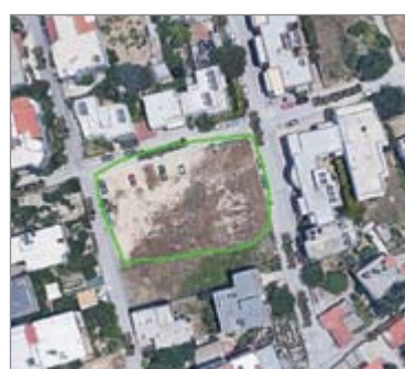
Θέμιδος και Κεραμεικού