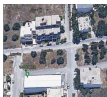
Καντινάας και Αρμονίας - Αρμονίας και Δάντη