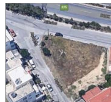
Αϊδινίου και Λιμπιρίτη

Κρασαδάκη. Συνεργασία με σκοπό την διατήρηση του χαρακτήρα του χώρου με στόχο την εκπαίδευση σε θέματα καλλιέργειας λαχανικών και ευαισθητοποίηση σε θέματα που αφορούν την προστασία του περιβάλλοντος σε μαθητές αλλά και κάτοικους του προαστίου. - Ενημέρωση για την πορεία της ανάπλασης των υφιστάμενων πάρκων του προαστίου. - Ενημέρωση για την πορεία προς την διαμόρφωση του πάρκου Ερυθραίας. - Ενημέρωση για την προοπτική δημιουργίας χώρων πρασίνου – πάρκων στους χαρακτηρισμένους κοινόχρηστους χώρους.