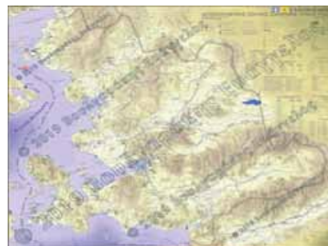
Τελικό χαρτογραφικό προϊόν: Ελληνισμός Διοικούμενης Ζώνης Σμύρνης (1919-1922)

Ως αποτέλεσμα των παραπάνω δημιουργήθηκε ένας σύγχρονος-θεματικός-ιστορικός χάρτης που απεικονίζει τις ελληνικές κοινότητες στη «Διοικούμενη Ζώνη Σμύρνης», όπως αυτή προέκυψε με τη Συνθήκη των Σεβρών (10.8.1920), από την Κατοχή της Σμύρνης στις 15 Μαΐου 1919 από τις ελληνικές δυνάμεις έως τη Μικρασιατική Καταστροφή (13-22.9.1922). Εκτός από τις ελληνικές κοινότητες και τα στατιστικά στοιχεία τους, ο χάρτης παρουσιάζει τους αρχαίους οικισμούς, τα εκκλησιαστικά κέντρα και τα εκπαιδευτικά ιδρύματα, τα οποία έπαιξαν καθοριστικό ρόλο για τον Ελληνισμό. Ενδεικτικά, επιτεύχθηκε η συγκέντρωση, η ταυτοποίηση, η ψηφιοποίηση και τέλος η παρουσίαση δεδομένων για 237 οικισμούς με ελληνικό πληθυσμό, 175 από τους οποίους με τουλάχιστον μία εκκλησία, 160 από τους οποίους με τουλάχιστον ένα σχολείο πρωτοβάθμιας ή δευτεροβάθμιας εκπαίδευσης και 87 τοποθεσίες, οι περισσότερες από τις οποίες κυριαρχήθηκαν από ελληνικά φύλα (Αιολείς, Ίωνες) κατά την αρχαιότητα. Επιπρόσθετα, εμφανίζεται η διοικητική διαίρεση της εποχής (σαντζάκια, καζάδες), το οδικό/σιδηροδρομικό και υδρογραφικό δίκτυο, καθώς και στοιχεία της τοπογραφίας της περιοχής. Τέλος, δίνονται αναλυτικά στοιχεία για τα πληθυσμιακά μεγέθη των καζάδων, τις ορδόδοξες εκκλησίες της Σμύρνης, τα γυμνάσια που λειτούργησαν κατά το τελευταίο σχολικό έτος πριν την Καταστροφή, την καταγραφή των εκποτισμένων κατά τον Πρώτο Διωγμό του 1914 και τέλος, τις χιλιόμετρικές αποστάσεις